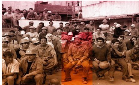
تجمع کارگران نیشکر هفت تپه همراه با تعدادی از خانواده های خود