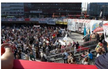
صحنه ای از تظاهرات سفر وزیر امور خارجه آمریکا به سوئد

تظاهرات های با شکوهی که در هفته های اخیر علیه سفر بوش و جنگ طلبان آدمکش در کشورهای مختلف برگزار گردید یک بار دیگر به روشنی نشان داد که در دنیای ما هیچ انسان آزاده ای را پیدا نمی کنید که از تجاوز بربرمنشانه به عراق، افغانستان و... حمایت کند. هیچ انسان آزاده ای را پیدا نمی کنید که از خروج فوری و بی قید و شرط بربرها از عراق و پایان دادن به تجاوز و پرداخت خسارت به مردم ستم دیده عراق حمایت نکند. هیچ انسان دموکرات و بشردوستی را پیدا نمی کنید که از قتل عام مردم عراق به بهانه مسلمان بودن و بنیادگرا بودن و ... حمایت کرده و مبارزه این ملت را برای رهائی ملی و آزادی کشورشان محکوم ننماید.