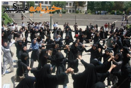
صحنه ای از پایان موفقیت آمیز اعتصاب دانشجویان تربیت معلم