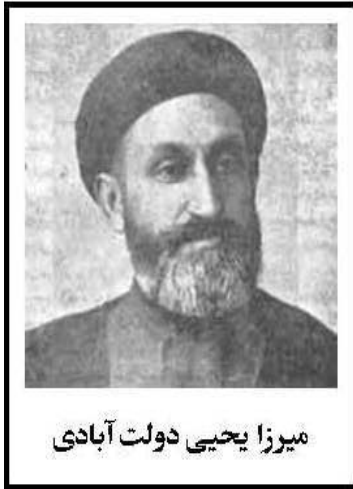
میرزا یحیی دولت آبادی

شاعر و نویسنده و از پیشقدمان فرهنگ نوین در ایران و مؤسس مدرسه سادات بود. وی از جمله یکی از مشهورترین رجال سیاسی عصر مشروطه و دوران پس از آن تا اوایل حکومت رضا شاه به شمار می آید.»